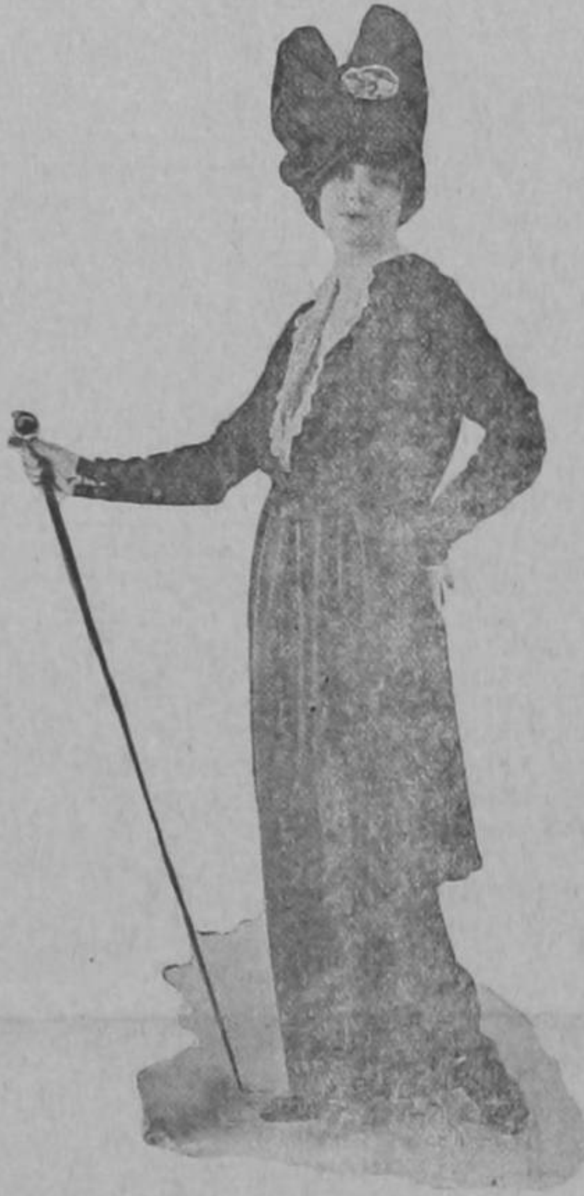
Vestido de tarde por Cheruit de París, de gabardina francesa azul oscuro. Falda entera, líneas rectas, consistiendo únicamente de túnica de cascada a la espalda, cuerpo simple, manga larga entallada, cuello acabado con bordado de batista blanca.